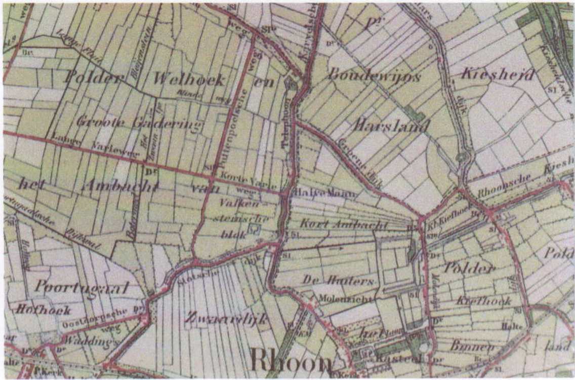
Kaart van 1906 waar café "De Halve Maan" vermeld staat. Gedeelte van kaart 523 van de Historische Atlas van Zuid-Holland. Deze atlas is in het bezit van de Oudheidkamer.