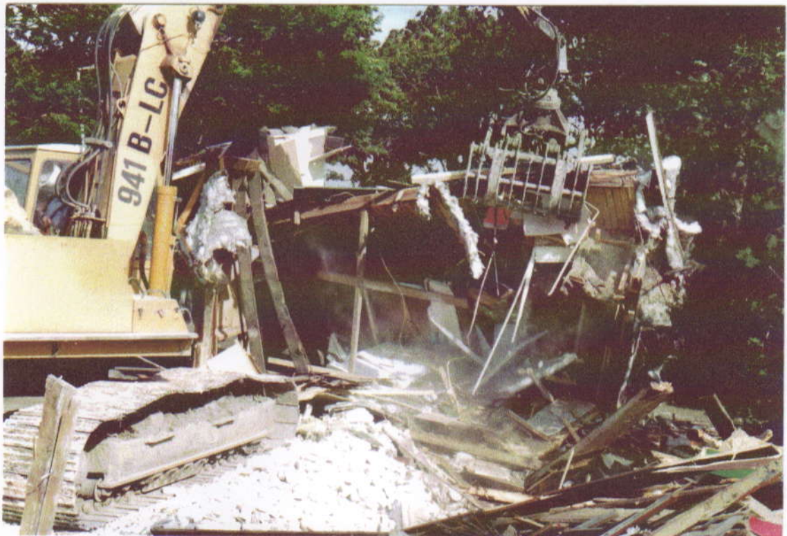
Na anderhalf jaar leegstand worden de drie huizen van de v.m. "Halve Maan" gesloopt. (oktober 1991)